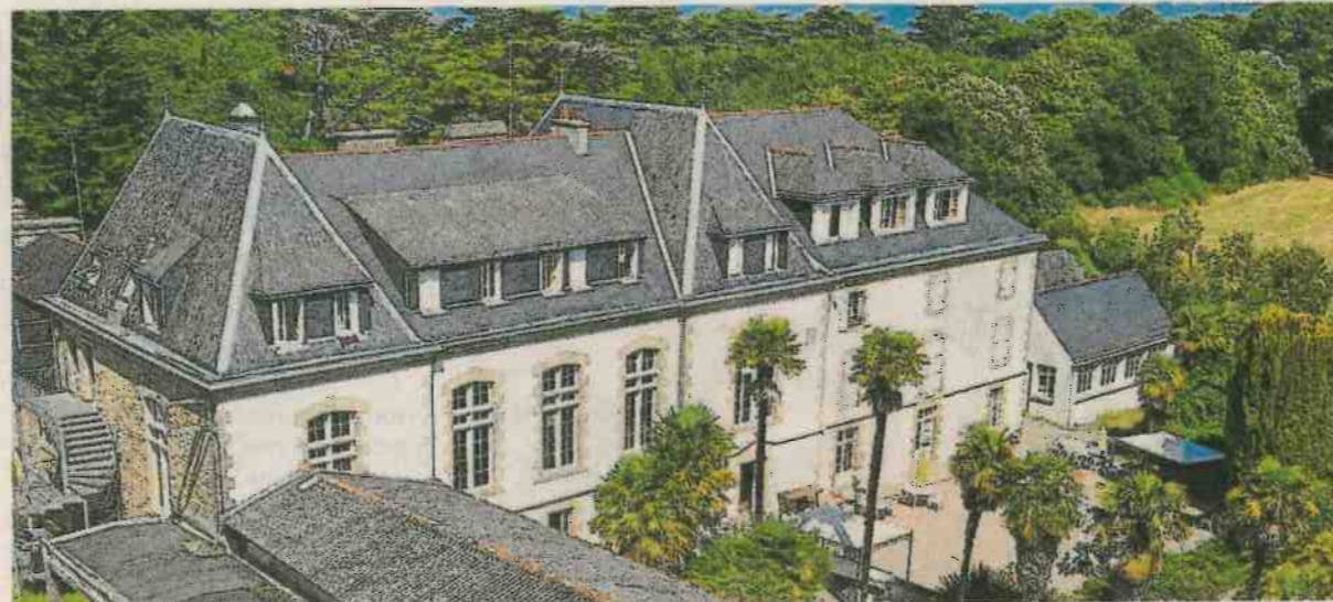
Le projet hôtelier porté par le groupe Giboire à Berder prévoit une extension des bâtiments sur une emprise au sol de 3 880 m 2 contre 2 989 m 2 actuellement. Une aire de stationnement permettant l'accueil de 80 à 100 véhicules pour les résidents est prévue.

Giboire insiste : « L'accès de l'île au public sera maintenu dans son état actuel. »